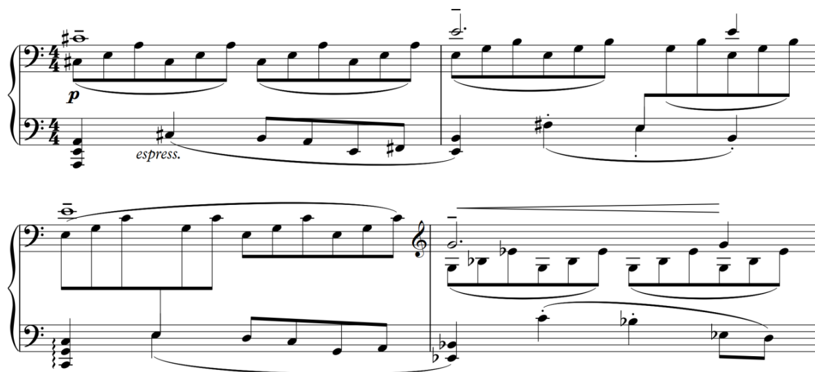
Рисунок 4. С. Борткевич «Esquisses de Crimée», «Les rochers d'Outche-Coche». II частина, декламаційна тема

Ці дві теми проводяться два рази, кожного разу змінюючись і набуваючи рис характеру одне одного. У другий раз тема ноктюрну набуває характеристик декламаційної теми, а саме : звучить у нижньому регістрі, має експресивний, а не пісенний характер. Натомість декламаційна тема проводиться у вищому регістрі, а наприкінці розділу над нею навіть з'являється авторська позначка dolce . Таким чином, дві контрастні теми наче зливаються воєдино в один нескінченний потік.