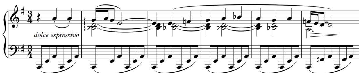
Рисунок 12. С. Борткевич «Esquisses de Crimee», «Idylle orientale», друга тема

Друга тема цієї п'єси є досить контрастною завдяки авторським позначкам piu tranquillo та dolce espressivo , відбувається модуляція в субдомінантову тональність a-moll. На фоні розкладених акордів звучить співуча мелодія, для якої характерні альтерації (тритони, збільшені секунди, акорди альтерованої субдомінанти), які передають колорит східної місцевості. Це спокійна музика, мелодія якої нагадує арабеску [7, 21], наспівна та відчутно прикрашена орнаментикою, що неспішно розгортається на фоні повільного погойдування арпеджованого акомпанементу.