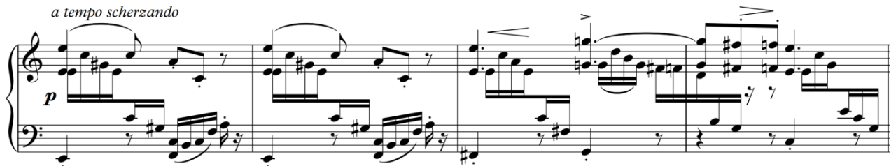
Рисунок 10. С. Борткевич «Esquisses de Crimée», «Caprices de la mer», друга тема

мотиви на p зі штрихом staccato . Другий елемент – рішучий висхідний мотив з активним crescendo . Їх розвиток призводить до яскравої кульмінації у вигляді низхідних каскадних пасажів.