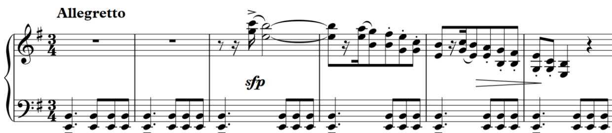
Рисунок 11. С. Борткевич «Esquisses de Crimee», «Idylle orientale», перша тема

Перший розділ п'єси ( Allegretto ) розпочинається з остинатних квінт у партії акомпанементу, на тлі яких проходить мелодія в тональності e-moll. Мелодія – речитативного, настороженого характеру, з пунктирним ритмом, виконується штрихом staccato і складається переважно з широких інтервалів, що створюють відчуття широкого простору. Гіпнотичний остинатний акомпанемент, що відлунює звучанням турецьких барабанів, та насторожена мелодія підкреслює східний колорит і змальовує нам картинку неприступної фортеці або замку.