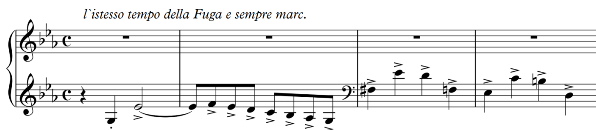
Рисунок 14. С. Борткевич «Esquisses de Crimee», «Chaos», фугато

Далі вступає альт у попередній тональності, після нього – сопрано у тональності натуральної домінанти. Протискладення не утримані, але ритмічно доповнюють тему за рахунок або синкоп, або гамоподібних рухів.