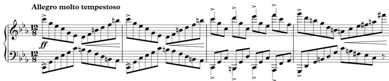
Рисунок 13 С. Бортович «Esquisses de Crimée», «Chaos», перший розділ

Другий розділ – це триголосне фугато, авторська позначка «l'istesso tempo della Fuga e sempre marcato» («в темпі фуґи та постійно підкреслюючи») – починається одразу з викладу теми в басу у тональності с-moll.