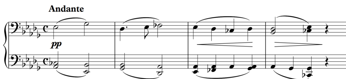
Рисунок 2. С. Борткевич «Esquisses de Crimee», «Les rochers d'Outche-Coche». I частина, тема хоралу

Перша частина розпочинається з теми, викладеної у фактурі триголосного хоралу, в тональності as-moll . Завдяки рівномірному ритму, плавній мелодичній лінії у низькому регістрі, цей хорал має суворий, серйозний характер, його звучання нагадує неприступні кам'яні скелі. Особливістю гармонії в цій темі є використання натуральної домінанти, що є дуже характерним для українського фольклору.