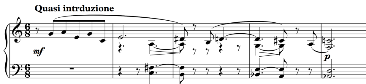
Рисунок 8. С. Борткевич «Esquisses de Crimée», «Caprices de la mer», вступ

Образна трансформація першої теми відбувається у першому розділі Allegro assai (15-31 т.). Тема повністю дублює звучання у вступі, але звучить більш схвильовано, емоційно, відбувається її активний розвиток. Цьому сприяє додавання композитором віртуозних хвилеподібних пасажів на тлі мелодії, з використанням незвичної поліритмії. Якщо у вступі мелодія закінчувалася зупинкою на акордах, то в першому розділі колористичні пасажі створюють відчуття безперервного руху.